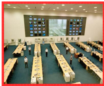
(2Fガラス越しの写真)

※オペレーションルームの撮影は常時可能。また、1Fのほか2Fからもガラス越しに可能です。