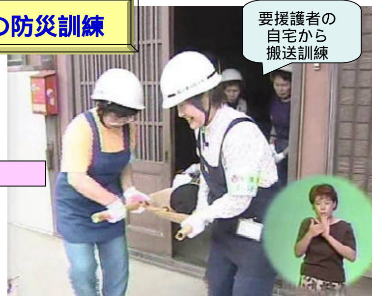
要援護者の 自宅から 搬送訓練

大月市猿橋区自主防災会では、災害時要援護者の受け入れ施設（福祉避難所）として、集落の中心部にある殿上公民館（耐震化施設）を位置づけ、毎年の自主防災訓練で、支援員（住民有志）が要援護者の自宅から（応急担架等で）福祉避難所まで搬送し、施設の中で介護を行う訓練を行っている。