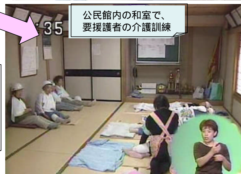
公民館内の和室で、 要援護者の介護訓練