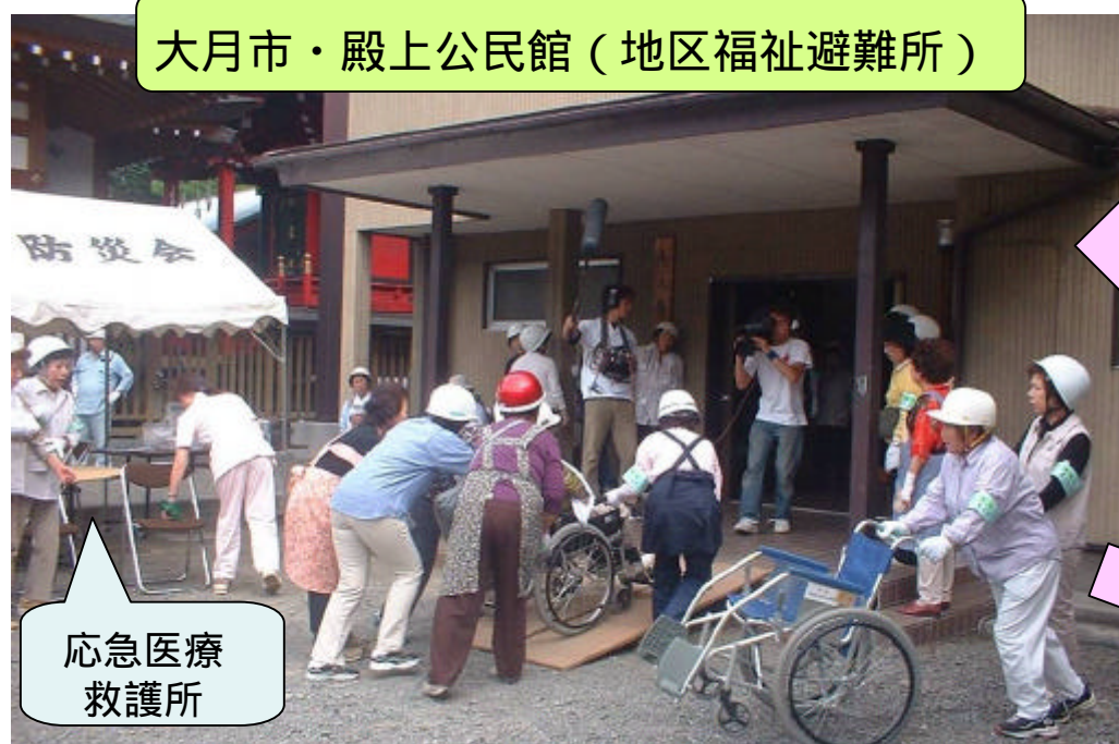
大月市・殿上公民館（地区福祉避難所）