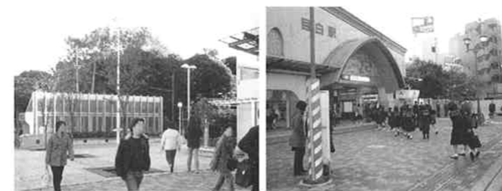
完成した目白駅前広場