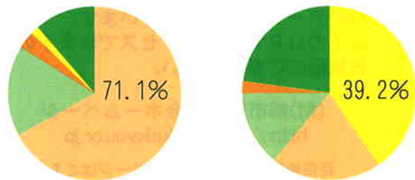
一般住宅の空き巣 39.2% マンションの空き巣 71.1%

ひったくり被害者（女性98%）が住宅地（83%）で後方から（97%）オートバイ（71%）もしくは自転車（43%）から手と肩からかばん（56%）のひったくりにあっています。