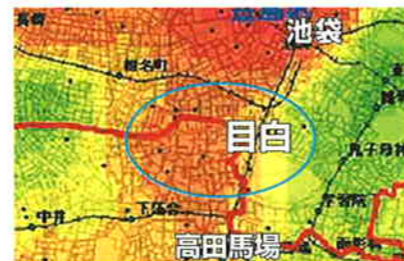
ひったくりマップ 目白は危ない！