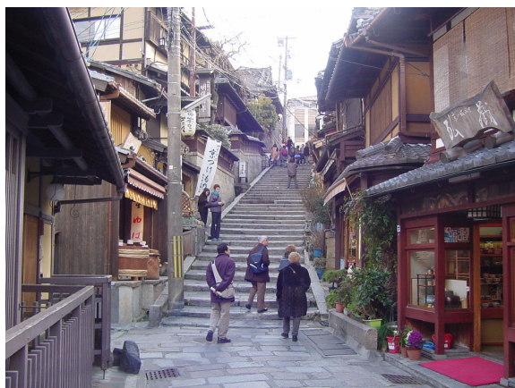
さんねいざか 産寧坂