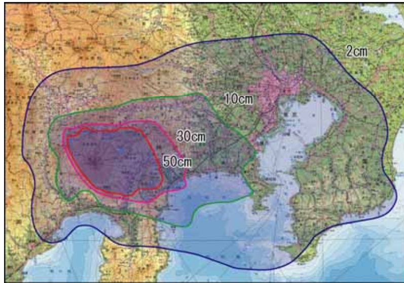
図2 富士山防災マップ（降灰の影響がおよぶ可能性の高い範囲）