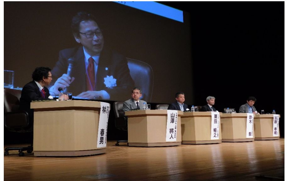
クロージングセッション