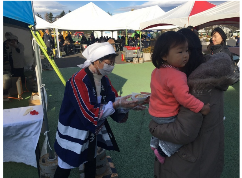
屋外展示(炊き出し)