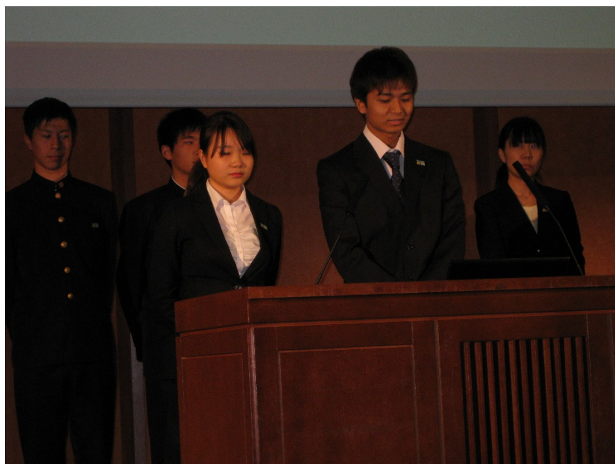
4時間目 学生の発表