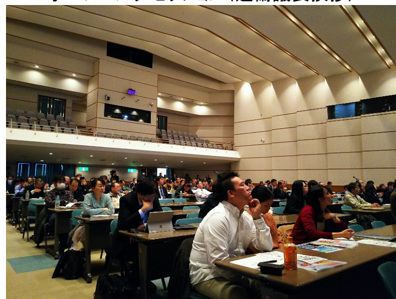
テーマセッション