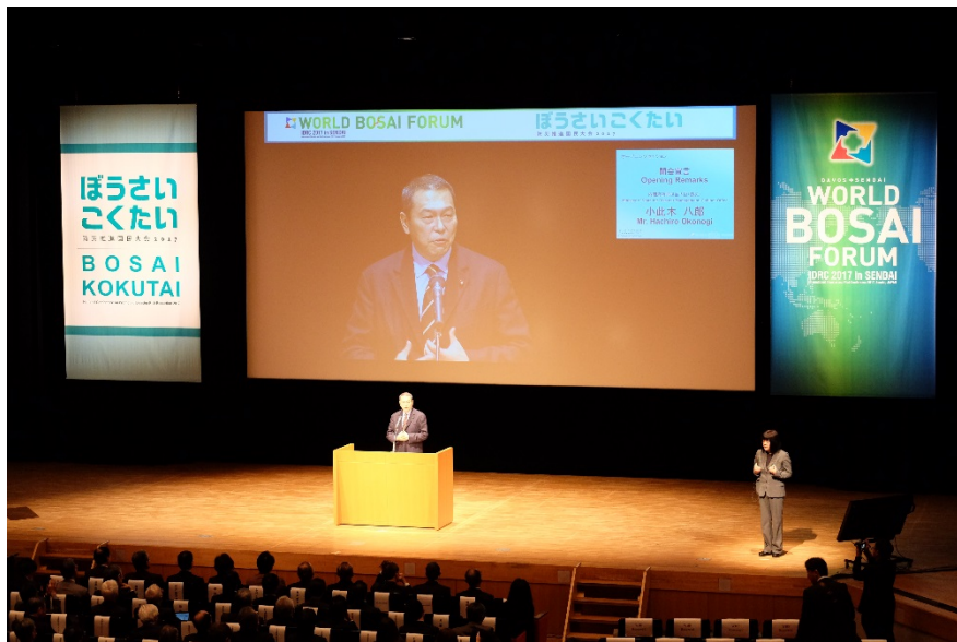
オープニングセッション(小此木防災担当大臣挨拶)