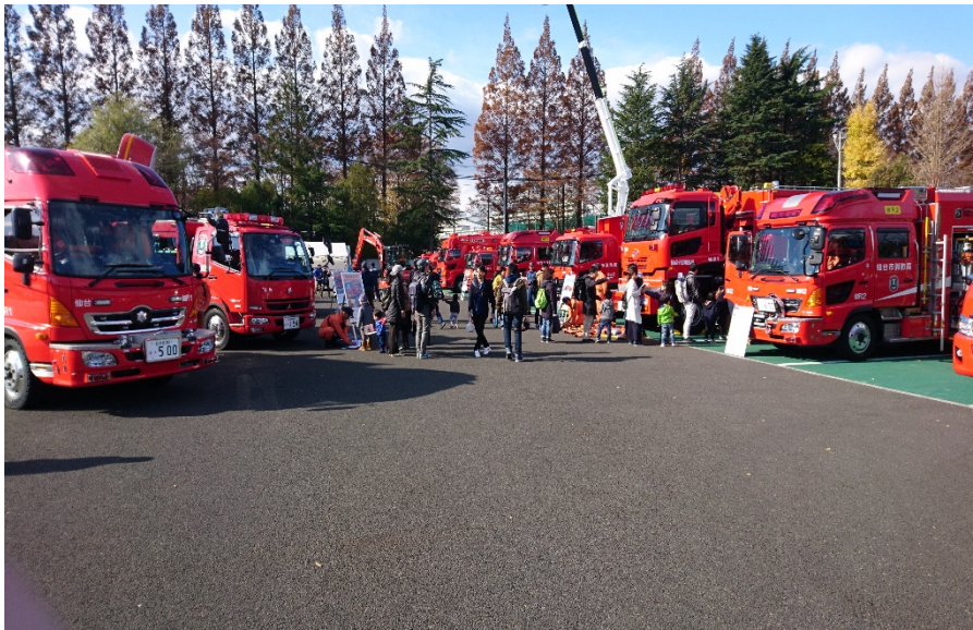
屋外展示(いろいろな消防車大集合)