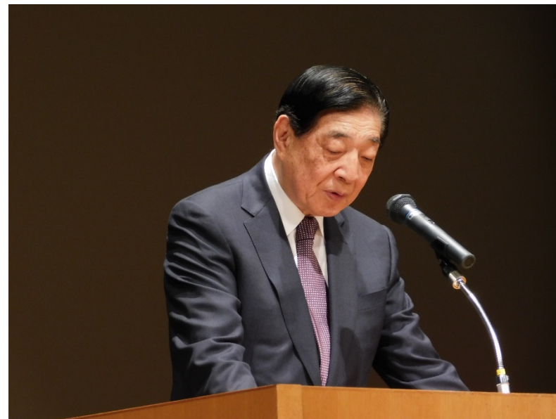
オープニングセッション(近衛議長挨拶)