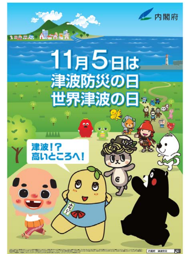
平成29年度ポスターデザイン