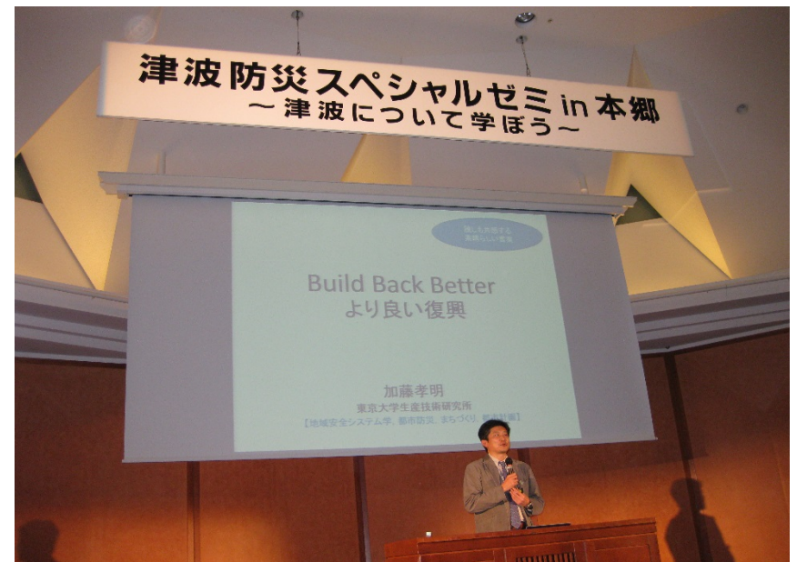
3時間目 ビルド・バックベター 加藤孝明先生