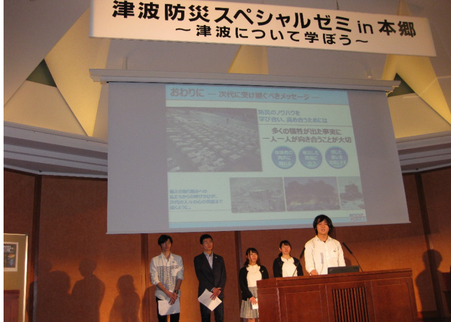
4時間目 学生の発表