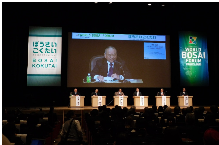
ハイレベル・パネルディスカッション