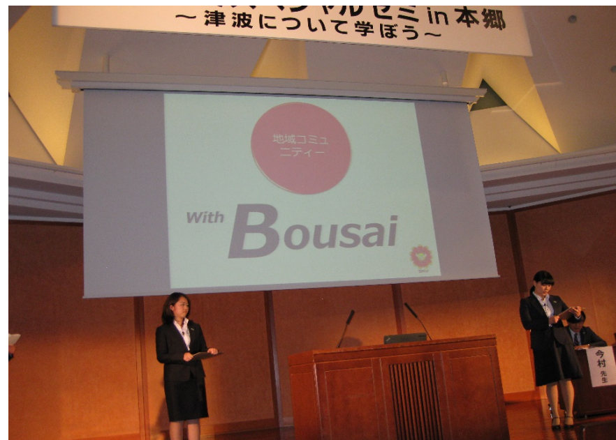
4時間目 学生の発表