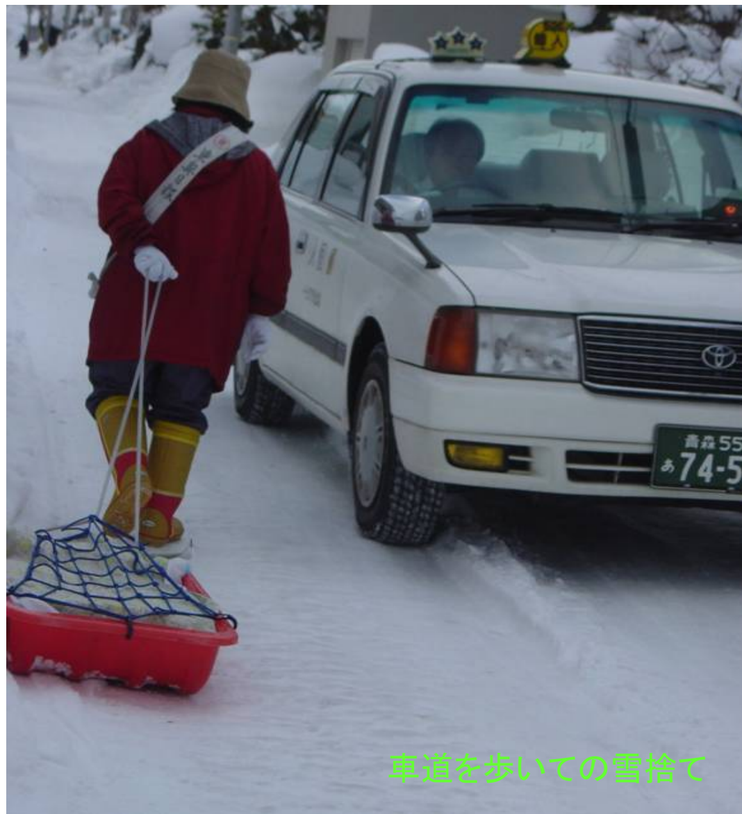
車道を歩いての雪捨て