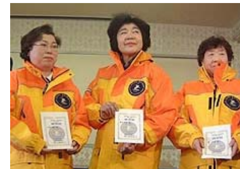
スノーナイト認定式