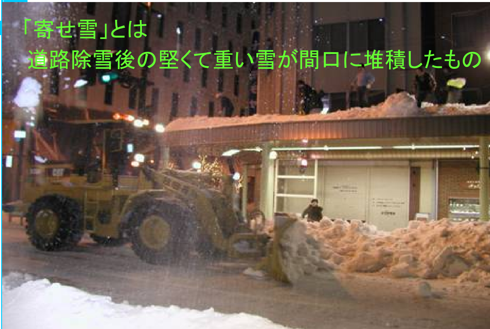
機械除雪により残される寄せ雪