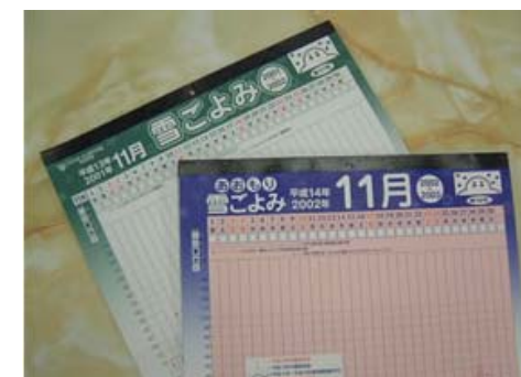
冬期限定の雪ごよみ