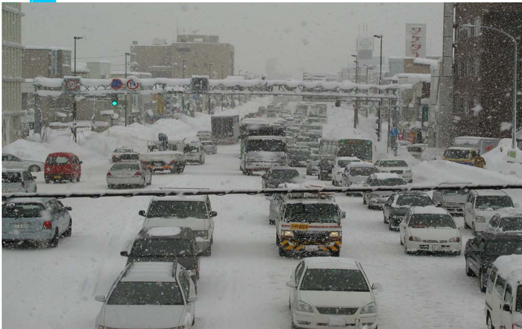
雪による幹線道路での渋滞