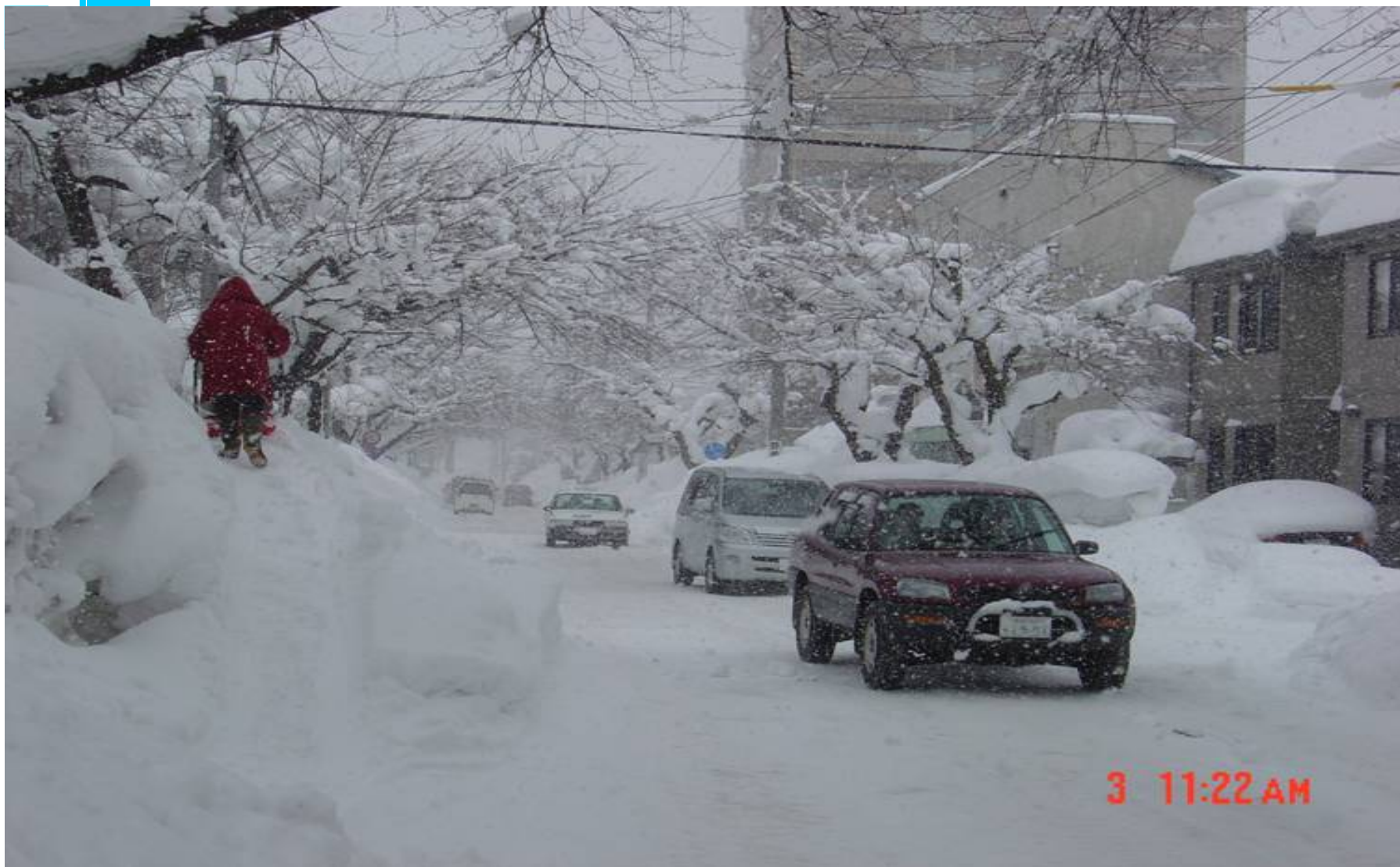
道路脇の車の高さを越える坂での雪捨て