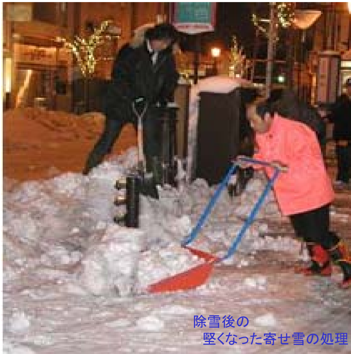
除雪後の 堅くなった寄せ雪の処理