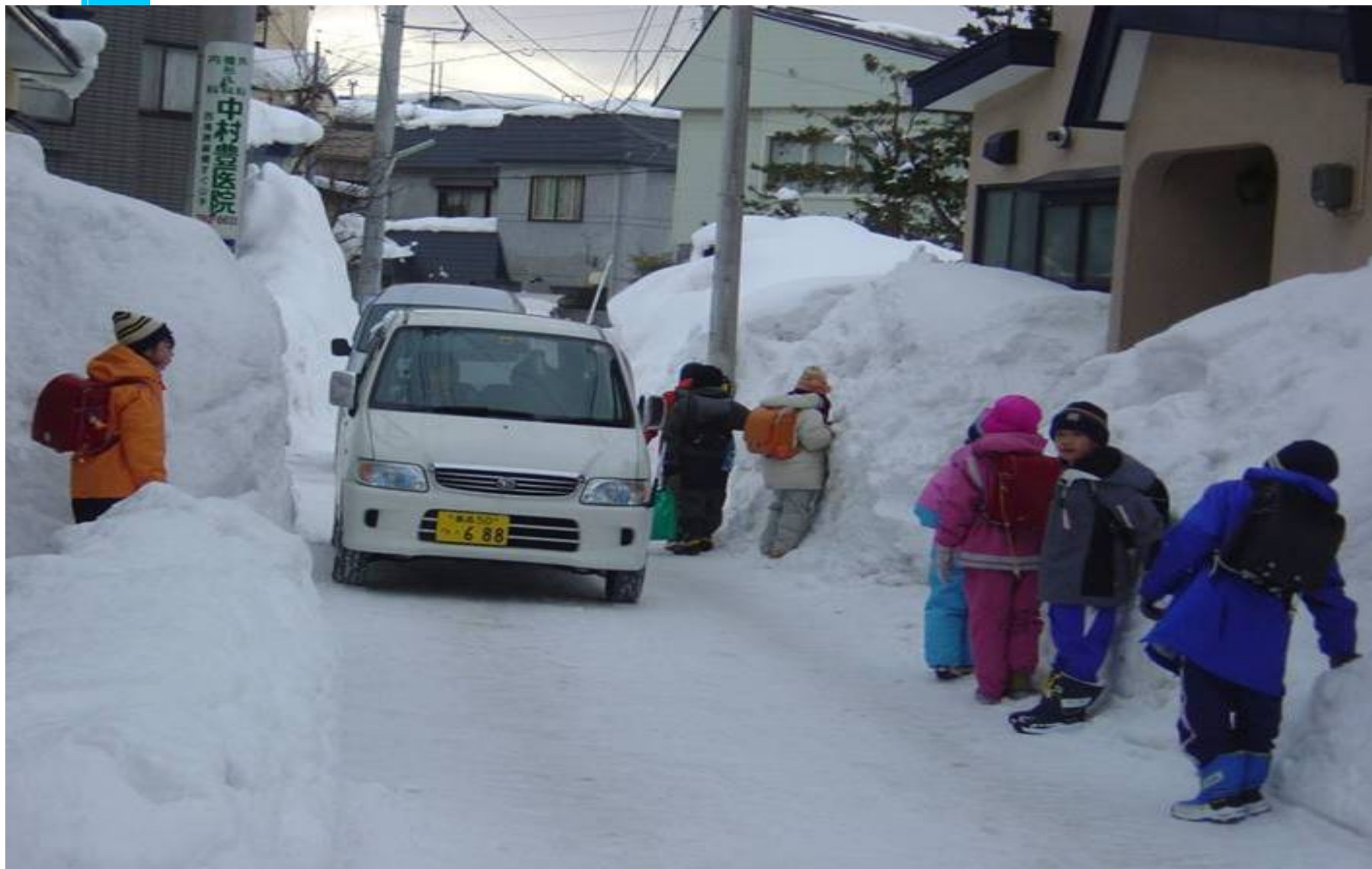
通学路で、雪の壁にへばりつく子供たち