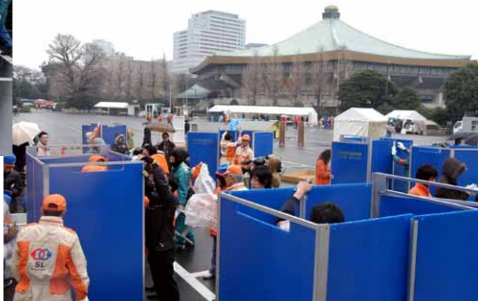
下水道管直結型トイレ組み立て訓練