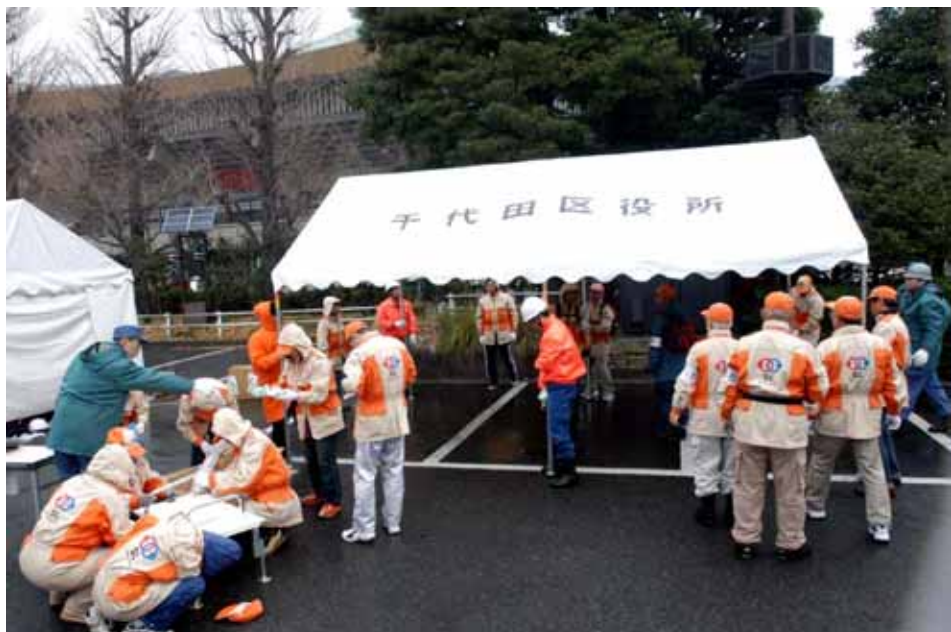
帰宅困難者支援本部開設訓練