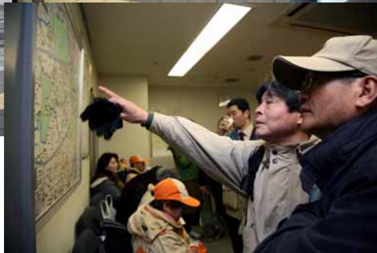
港区赤坂総合支所での受入れ(上) 港区役所職員の出迎え(右上) 支所内での情報提供(右)