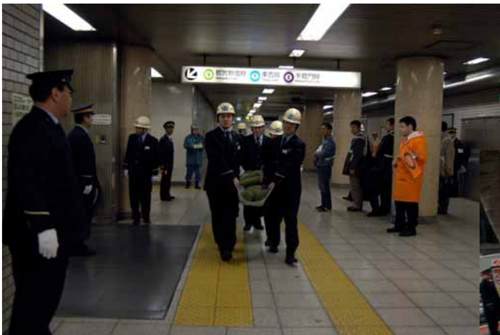
東京メトロ職員による担架搬送