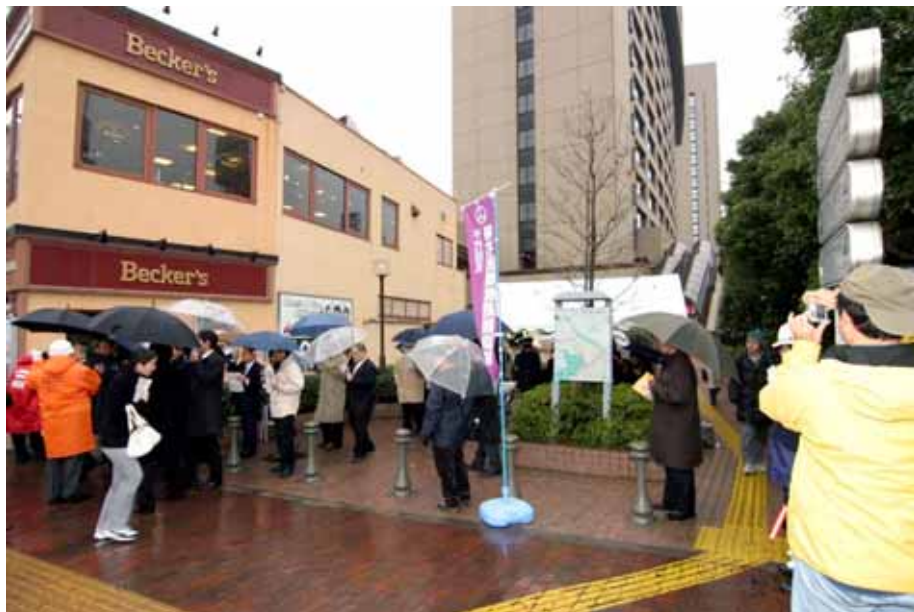
JR飯田橋駅前の様子