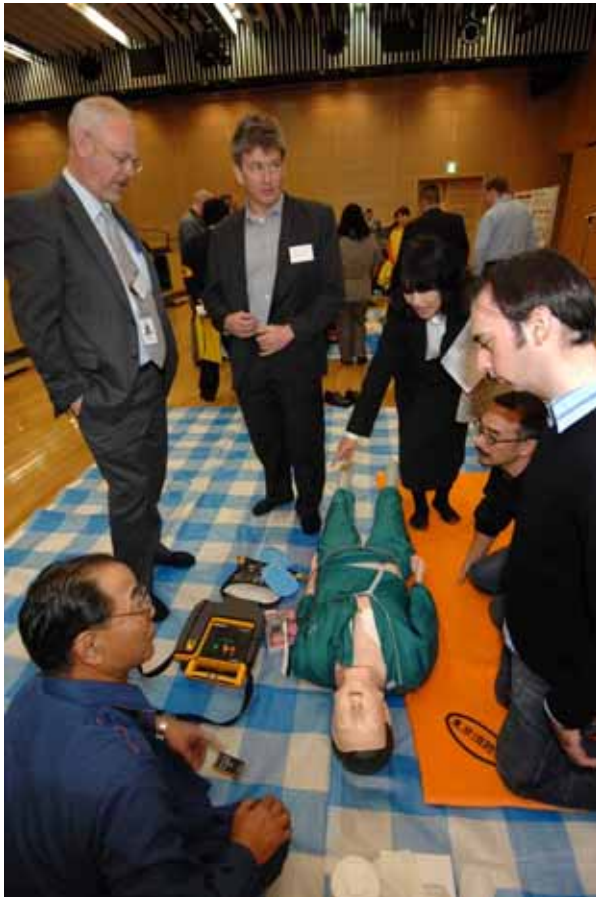
外国人を対象とした応急救護訓練(左) おいしい非常食の試食会(下)