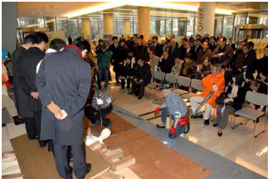
初動(救出)対応訓練