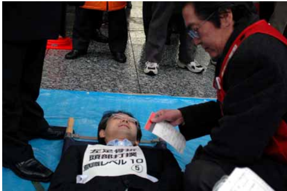
医師によるトリアージ