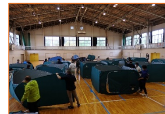
避難所開設・運営訓練