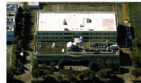
(立川広域防災基地)