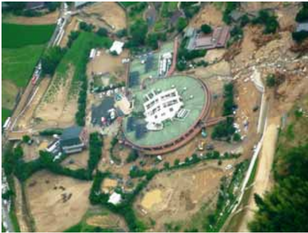
特別養護老人ホームの土砂災害現場 (山口県防府市)