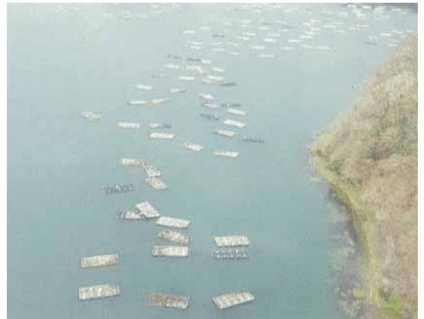
被災して漂流する養殖施設(岩手県大船渡湾)