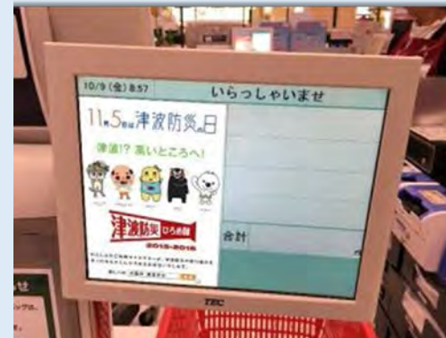
全国の総合スーパー「イオン」の462店のレジディスプレイ（イオングループ各社様）