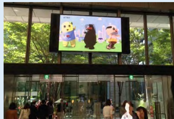
丸ビル・丸の内ビジョン (三菱地所株式会社様)