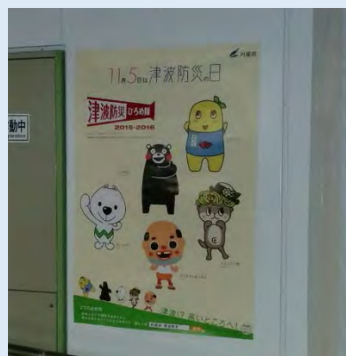
国会議事堂前駅 (東京地下鉄株式会社様)