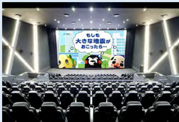
イオンシネマ全国684スクリーンでの放映 (イオンエンターテイメント株式会社様)