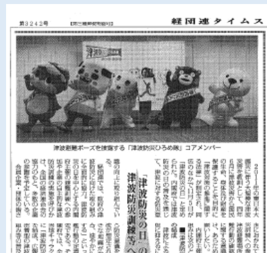
経団連タイムス（平成27年10月15日号）