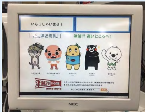
株式会社ローソン様