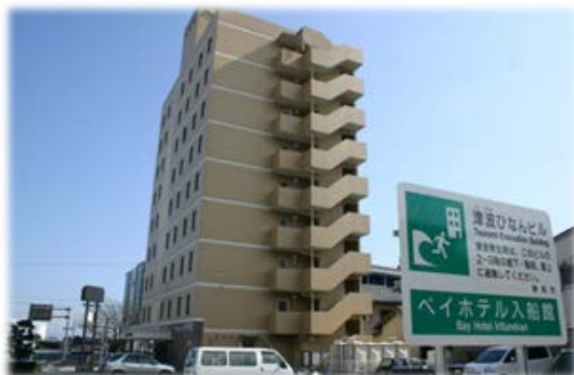
津波避難ビル（静岡県静岡市）