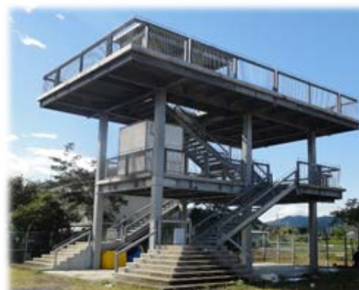
津波避難タワー（高知県黒潮町）