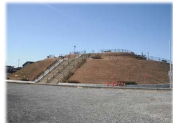
築山・命山（静岡県袋井市）