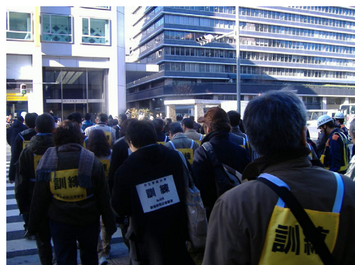
滞留者の誘導訓練の様子（平成20年度新宿駅周辺）