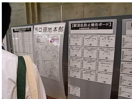
情報共有ボード（平成 22 年新宿駅周辺）

東京都内の既存協議会においては、現地本部又は情報提供ステーションにおいて大型の掲示板（情報共有ボード）を設置し、それを介して情報を受発信する取組を実施している。あわせて、新しいメディア等を活用した情報提供の手段も検討されている。