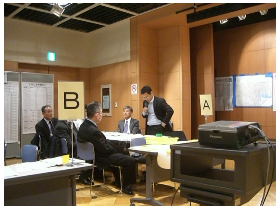
机上（図上）訓練の実施状況（平成 22 年度新宿駅周辺）