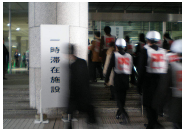
一時滞在施設の開設訓練の様子（平成 24 年度新宿駅周辺）