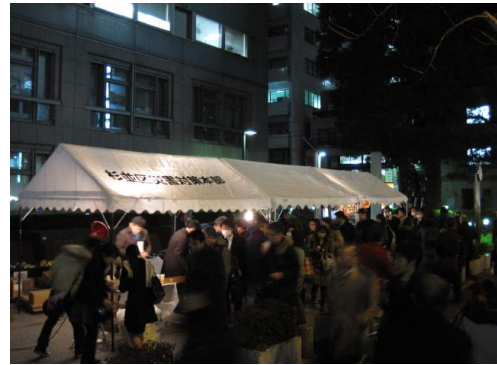
東日本大震災時の徒歩帰宅の様子