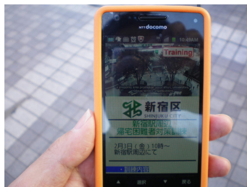
エリアワンセグによる情報発信 （平成 24 年新宿駅周辺）