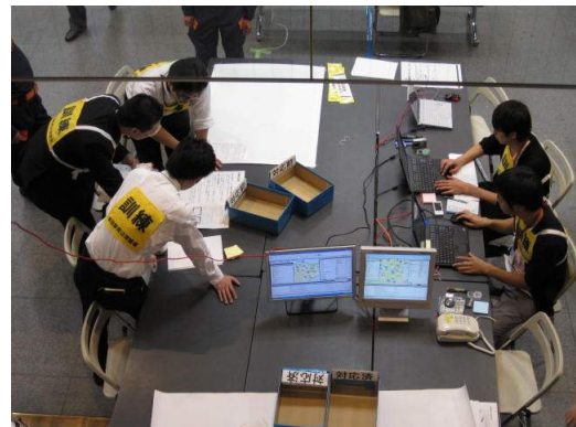
現地本部等の立ち上げ訓練の様子 平成22年新宿駅周辺