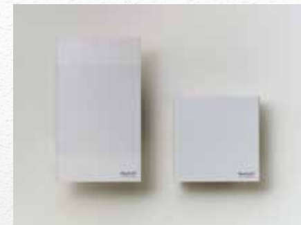
左から:感震センサー(グラッとくん) 電源遮断装置(シャットさん)