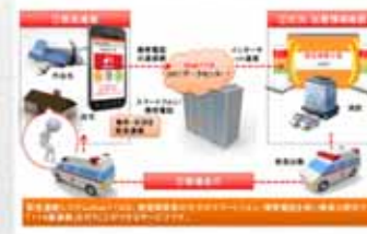
緊急通報システムWeb119