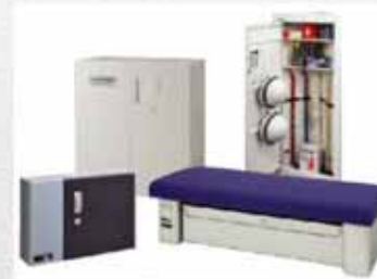
地震感知キャビネット