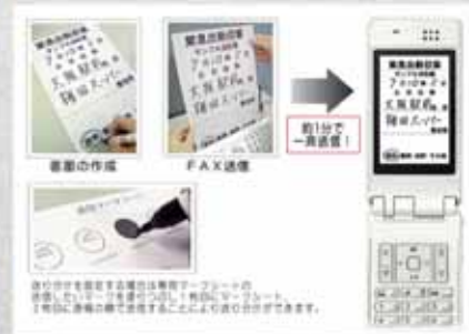
防災情報一斉送信システムソフトウェア