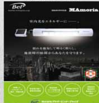
振動検知照明装置