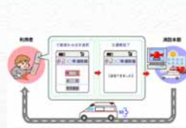
生活弱者のための緊急Web通報システム