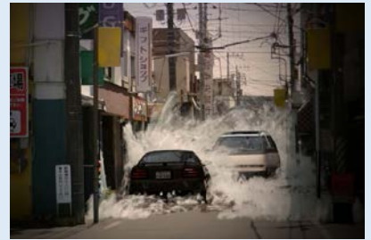
巨大津波による被害