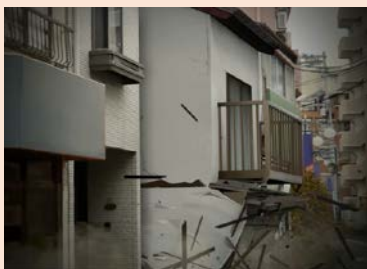
強い揺れによる 建物崩壊