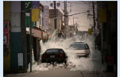
巨大津波による被害