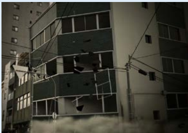
強い揺れによる 建物崩壊