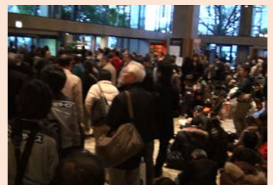
帰宅困難者の大量発生