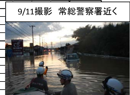
9/11撮影 常総警察署近く