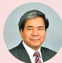
浦島 郁夫 熊本県知事