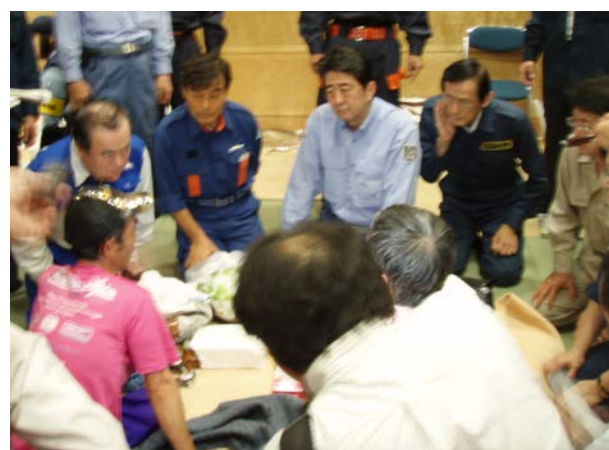
被災者一人一人に声をかける安倍総理② 【避難所（石下総合運動公園体育館）】