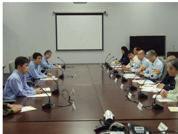
栃木県知事との意見交換 【栃木県庁】