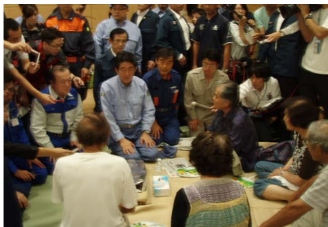
被災者一人一人に声をかける安倍総理① 【避難所（石下総合運動公園体育館）】