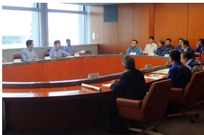
茨城県知事との意見交換 【茨城県庁】