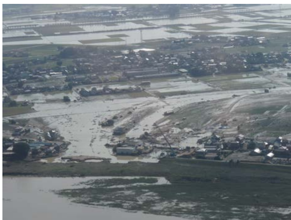
上空からの被災箇所（鬼怒川破堤箇所） 【茨城県常総市】