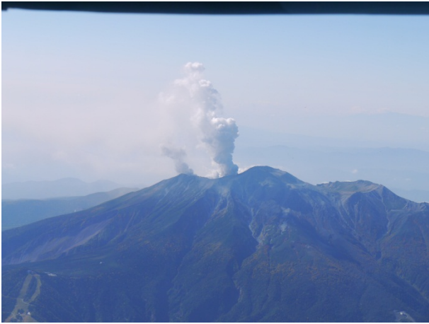
ヘリによる上空視察① 【御嶽山上空】