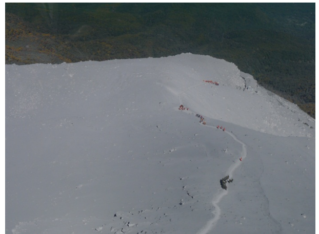
ヘリによる上空視察④ 【御嶽山上空】