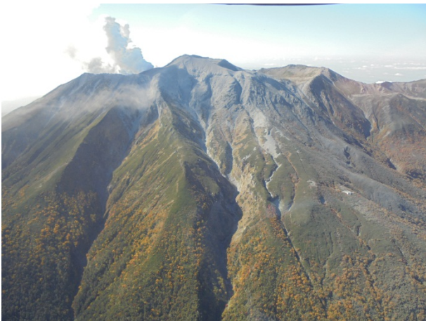
ヘリによる上空視察③ 【御嶽山上空】