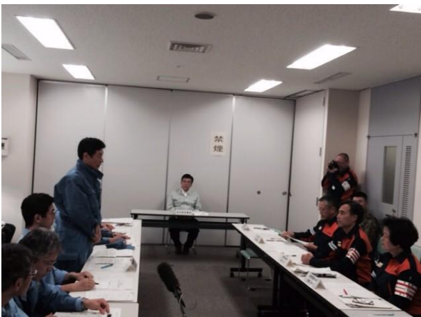
長野県知事等との意見交換会の様子 【長野県庁】