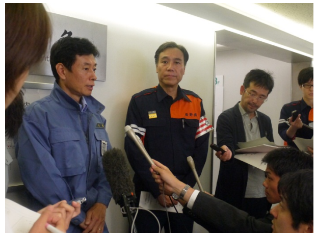
意見交換会後の取材に対応する西村副大臣 【長野県庁】