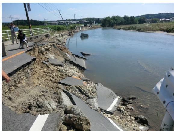
国道422号の被害の様子【伊賀市 カンベ 神戸地区】