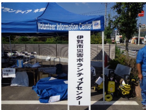
災害ボランティア活動拠点【伊賀市三田地区】