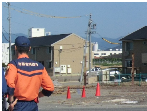
浸水被害を受けた住宅街の様子 【伊賀市三田地区】