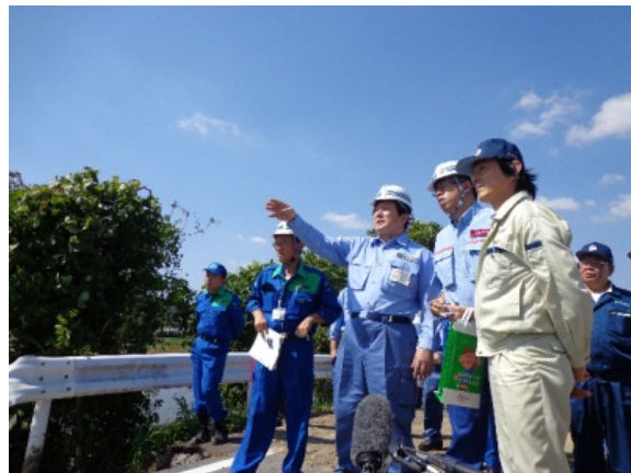
被害現場の状況を調査する亀岡政務官 【伊賀市神戸地区】