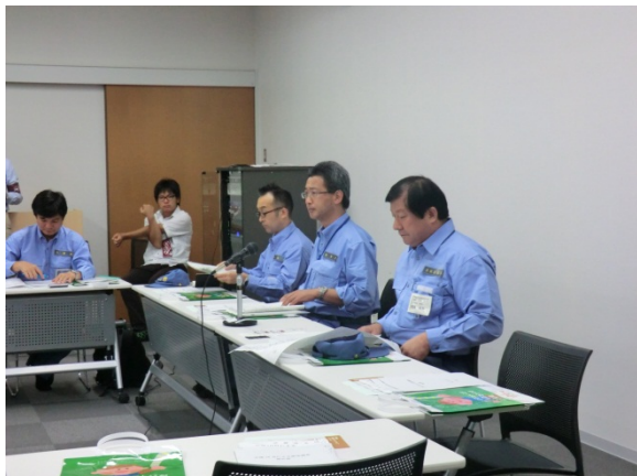
被害状況の説明を受ける亀岡政務官 【伊賀市役所】