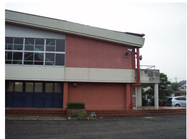
矢板小学校体育館被害の状況（屋根破損） 【栃木県矢板市本町地区】