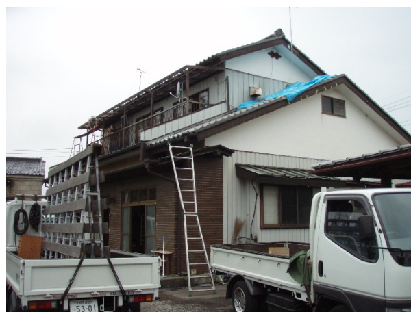
住家被害の状況③ 【栃木県塩谷町大久保地区】