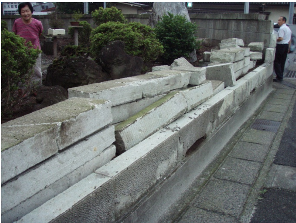
住家被害の状況⑤（ブロック塀倒壊） 【栃木県矢板市鹿島町地区】