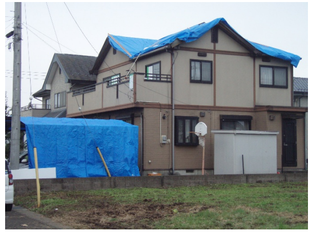
住家被害の状況④ 【栃木県矢板市矢板地区】