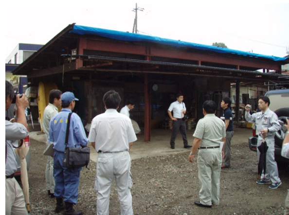
住家被害の状況⑦ 【栃木県矢板市本町地区】