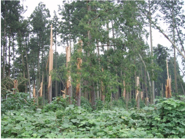
防風林の状況 【栃木県塩谷町大久保地区】