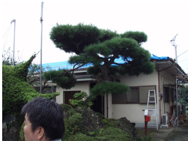
住家被害の状況⑥ 【栃木県矢板市本町地区】