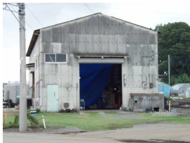
倉庫被害の状況 【栃木県鹿沼市茂呂地区】