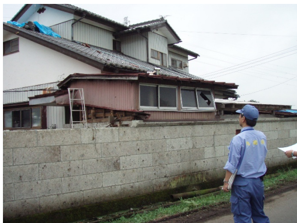
住家被害の状況② 【栃木県塩谷町大久保地区】