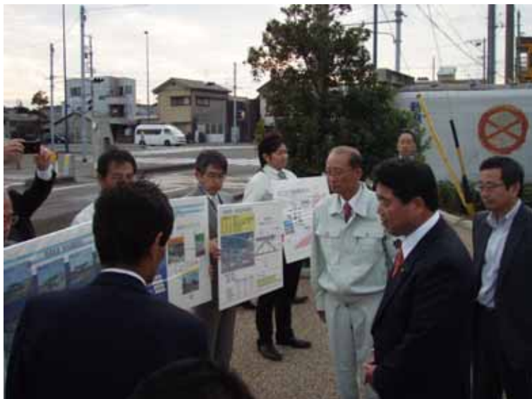
静岡県から焼津漁港内津波対策施設について説明を受ける下地大臣 (焼津市内)