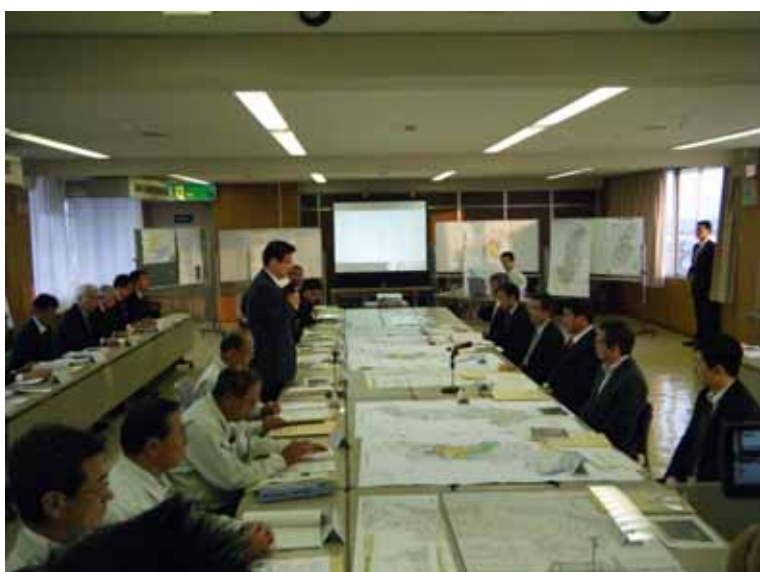
川勝静岡県知事、清水焼津市長等と津波対策等について意見交換する下地大臣 (焼津市庁舎内)